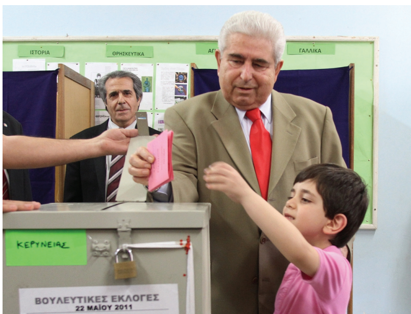
President Dimitris Christofias i vallokalen.

Turkcypriotiska fackföreningsmedlemmar demonstrerade i mars mot det sparpaket och de privatiseringar som Turkiet ålagt dem. Demonstrationer förekom även i Bryssel utanför EU-parlamentet, då demonstranterna främst klagade på att den turkcypriotiska identiteten urholkas i och med de många bosättare som illegalt förs in av Turkiet i det ockuperade området.