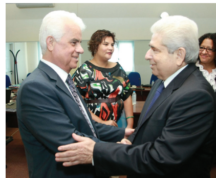
Dervis Eroglu och Dimitris Christofias.

Vid mötet den 12 maj lade president Christofias fram ett förslag bland annat om den federala polisens befogenheter. Han sa också att en internationell konferens om Cypernfrågan "kan ske när parterna på alla plan är nära en överenskommelse".